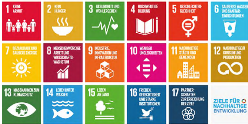
Die 17 Ziele für nachhaltige Entwicklung der Vereinten Nationen (UN)