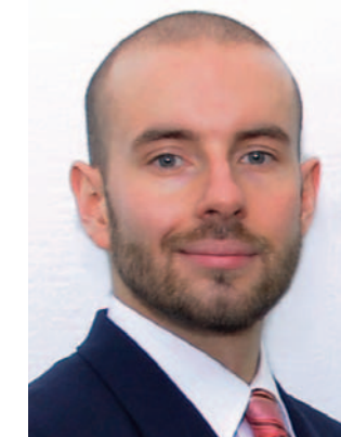
Alexander Thun Alfred Thun GmbH & Co.KG

land. Die meisten kommen aus Asien und das bedeutet: der CO 2 -Fußabdruck des Fahrrades steigt. Hier setzt Thun an, denn man ist überzeugt: Eine Industrie, die sich mit einem nachhaltig nutzbaren Produkt schmückt, sollte auch die eigenen Prozesse nachhaltig gestalten!