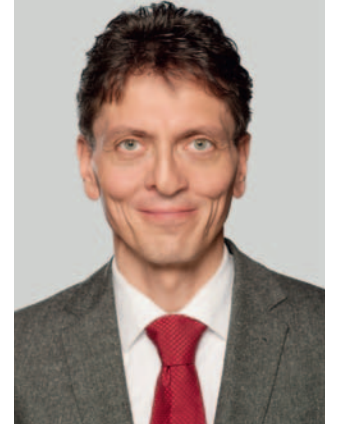
Christian Gaebler Staatssekretär der Senatsverwaltung für Stadtentwicklung und Umwelt zur Berliner Radverkehrspolitik

Arbeitgeber gesucht und ausgezeichnet werden. Bei der Auftaktveranstaltung zum Wettbewerb 2012 spricht u.a. Christian Gaebler, Staatssekretär der Senatsverwaltung für Stadtentwicklung und Umwelt zur Berliner Radverkehrspolitik. Zugleich werden auch vier Berliner Unternehmen ausgezeichnet, die sich beim letztjährigen Wettbewerb einen Namen machen konnten.