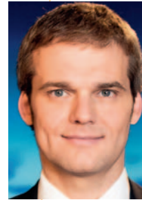
Thorsten Schröder ARD-Tagesschau- sprecher

Nun soll mit dem neuen NRVP 2020 der Radverkehr weiter entwickelt werden. Ein Expertengremium hat 2011 im Auftrag des Bundesverkehrsministers hierfür Eckpunkte erarbeitet, die Hoffnung auf neuen Schwung machen. Augenblicklich ist der neue NRVP noch in der internen Abstimmung im Ministerium. Gerade der richtige Zeitpunkt, dass Vertreter der Fahrradwirtschaft, der Politik und der Verbände ihre Erwartungen artikulieren und diskutieren. Gäste auf dem Podium sind unter der