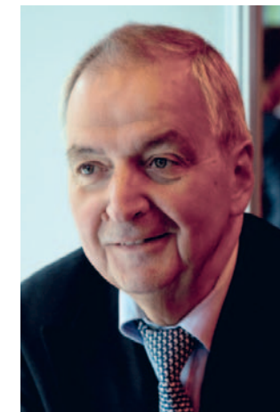
Prof. Dr. Dr. h.c. mult. Klaus Töpfer

Den Kongress der Fahrradbranche »viva velo « begleiten meine besten Wünsche.