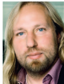
Dr. Anton Hofreiter